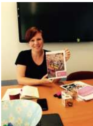
Besøk hos Movisie i Nederland

Senteret sender ut nyhetsbrev til over 400 abonnenter og har en aktiv facebookside med over 630 følgere. Siden brukes for å dele egne og andres arrangementer samt aktuell og relevant informasjon og nyheter. I tillegg fikk senteret i siste halvdel av 2016 en instagramprofil som har 85 følgere. Både facebook og instagram brukes aktivt for å bygge nettverk.