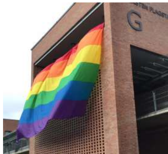
Under Mangfoldsmarkering ble det flagget med Pride-flagget på Universitetet i Agder.

Universitetet i Agder etterstreber å være et ikke-diskriminerende universitet, og ønsker at alle skal føle seg inkludert og velkommen som ansatt og student. I august arrangerte derfor Senter for likestilling, Studentskipnaden i Agder (SIA), Tilretteleggingskontoret ved Universitetet i Agder og Kafe Campus Mangfoldsmarkeringen i studentkantina på Universitetet i Agder, Campus Kristiansand. Arrangementet ble holdt under Skeive Sørlandsdager. Senteret jobber for at Mangfoldsmarkeringen skal bli et årlig arrangement på begynnelsen av studiestart.