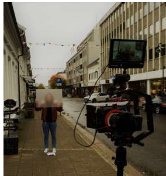
Opptak av teasere til Likestillingskonferansen 2016.

Til sammen 16 arrangementer med over 750 deltakere avholdt i 2016.