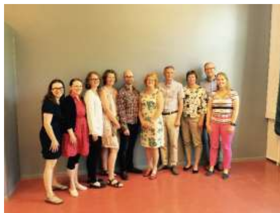
Dialogmøte med Likestillingscenteret, LHBTI-senteret og KUN