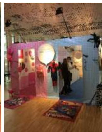
Sveriges Kommuner och Landsting utstilling.