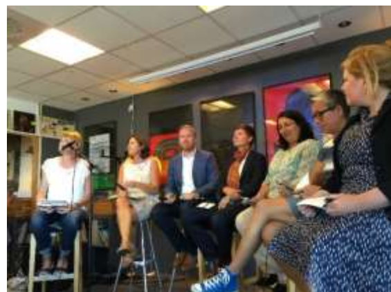
Panel-debatt under arrangementet Likestilling - Alles ansvar, hvem tar jobben? på Arendalsuka.