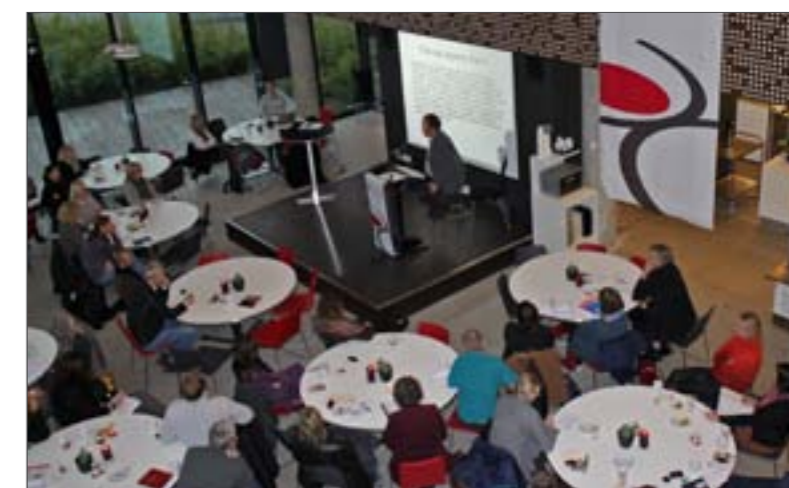
Mer enn 50 personer møtte frem da forskningsrapporten "Det gode liv på Sørlandet og tradisjonelle kjønnsroller" ble presentert 17. november.